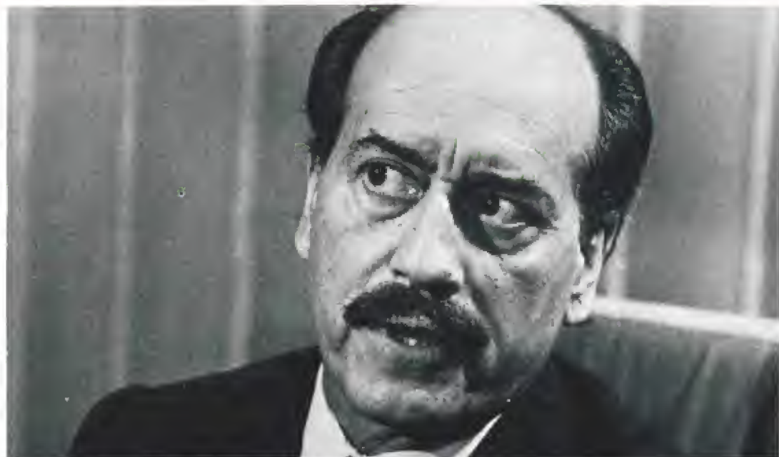
Jose Luis Lopez Vázquez